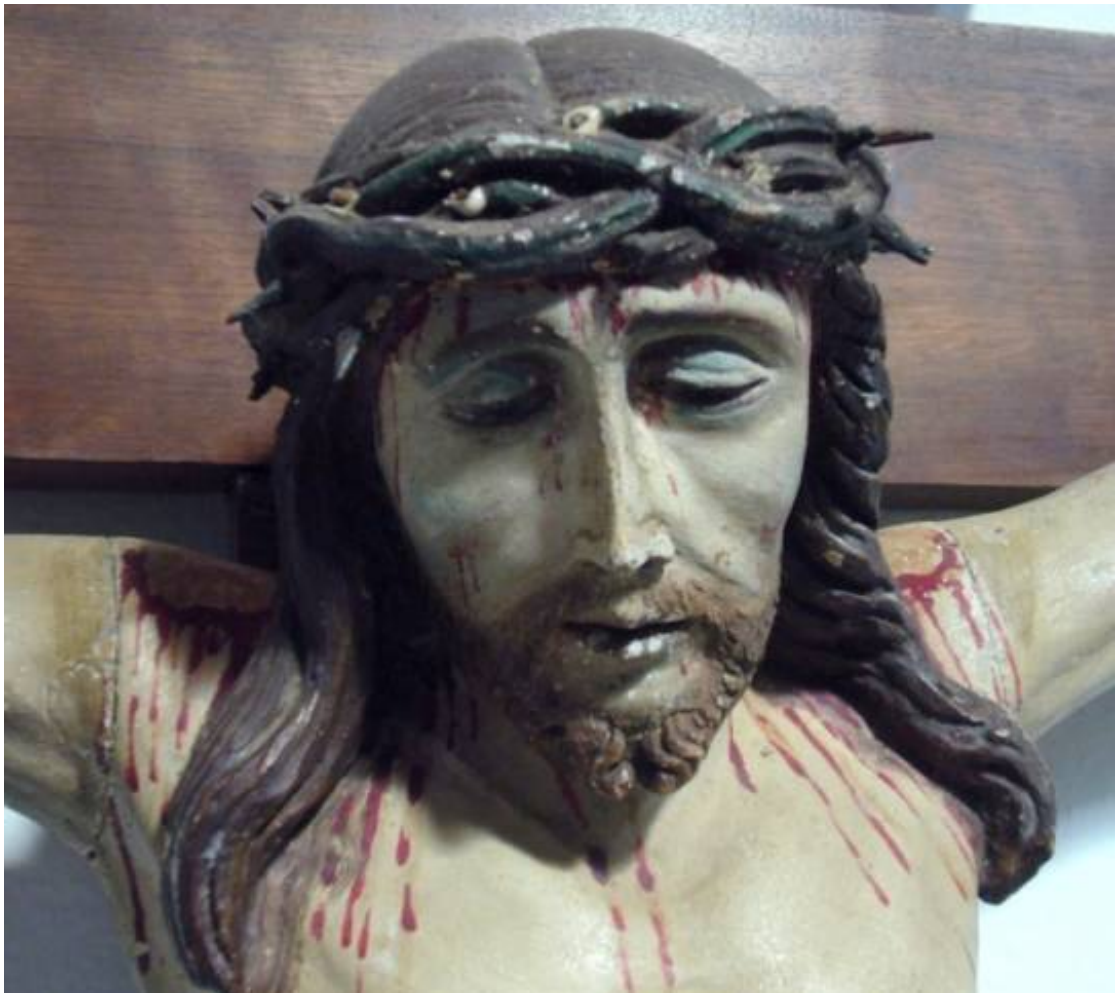
Detalhe escultura de Jesus na cruz. mais