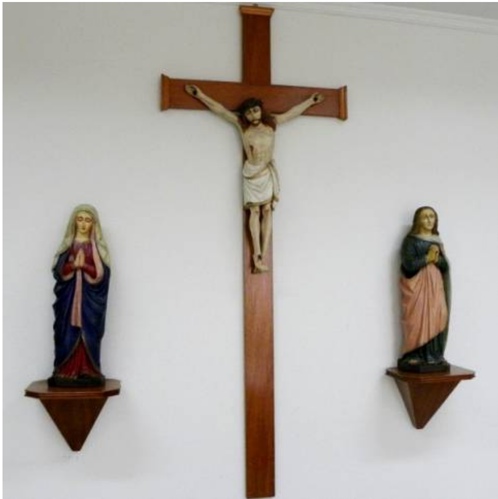
Conjunto de esculturas do Calvário. mais