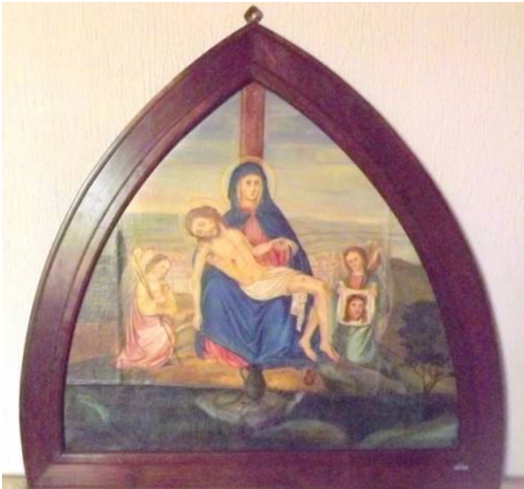
Quadro da Virgem Maria com Jesus. mais