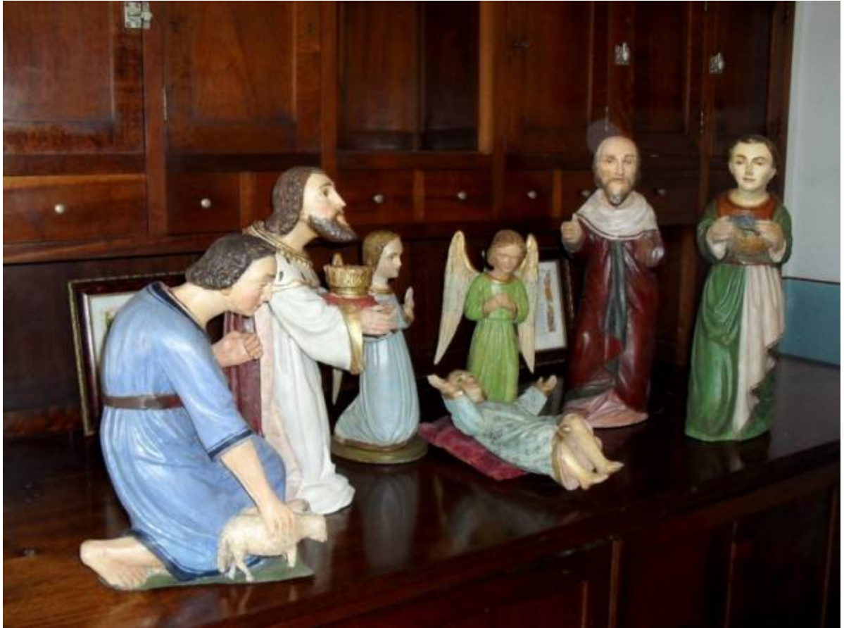
Conjunto de esculturas do presépio. mais