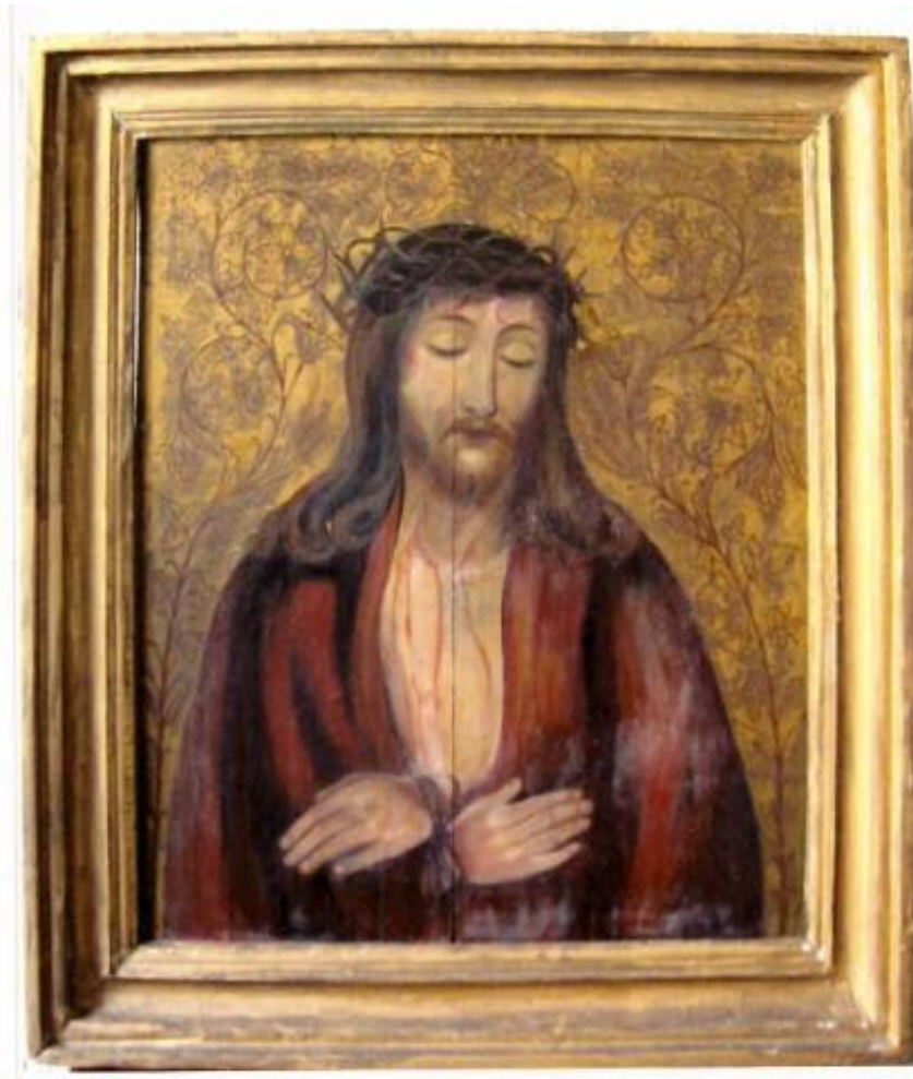
Quadro de Jesus flagelado. mais